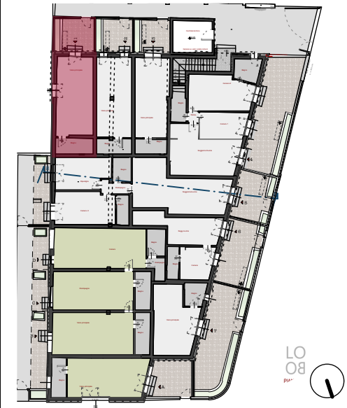
Piano Terra_Scala 1:500